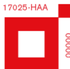
Slika 1. Primjer akreditacijskog simbola

Propisano je da uzorkovanje i analizu mogu raditi akreditirani laboratoriji. Oni imaju pravo staviti akreditacijski simbol na izvještaj. U praksi, na mnogim izvještajima nema akreditacijskog simbola, Slika 1., s brojem akreditacije, tako da ovlaštenik mora provjeravati je li laboratorij akreditiran ili ne. Popis akreditiranih laboratorija dostupan je na stranicama Hrvatske akreditacijske agencije. ( www.haa.hr ).