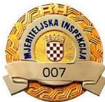
Značka mjeriteljskog inspektora