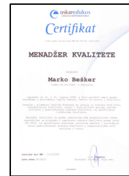
Certifikat Oskar Edukosa