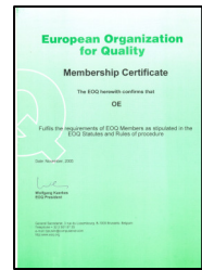
Certifikat Europske Organizacije za Kvalitetu